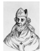
Erzbischof Anno II. (1056-1075)

Bij regionale en landelijke wedstrijden werd Bödefeld in 1979 en 1981 uitgekozen tot mooiste dorp en kreeg het een gouden medaille. In 1983 kreeg Bödefeld nog eens de zilveren medaille en staat daarmee in het rijtje van mooiste dorpen van Duitsland.