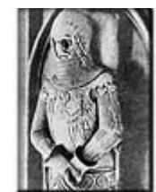
Graf Gottfried IV