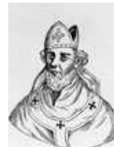
Erzbischof Anno II. (1056-1075)

Bij regionale en landelijke wedstrijden werd Bödefeld in 1979 en 1981 uitgekozen tot mooiste dorp en kreeg het een gouden medaille. In 1983 kreeg Bödefeld nog eens de zilveren medaille en staat daarmee in het rijtje van mooiste dorpen van Duitsland.