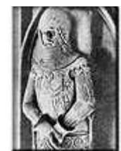
Graf Gottfried IV